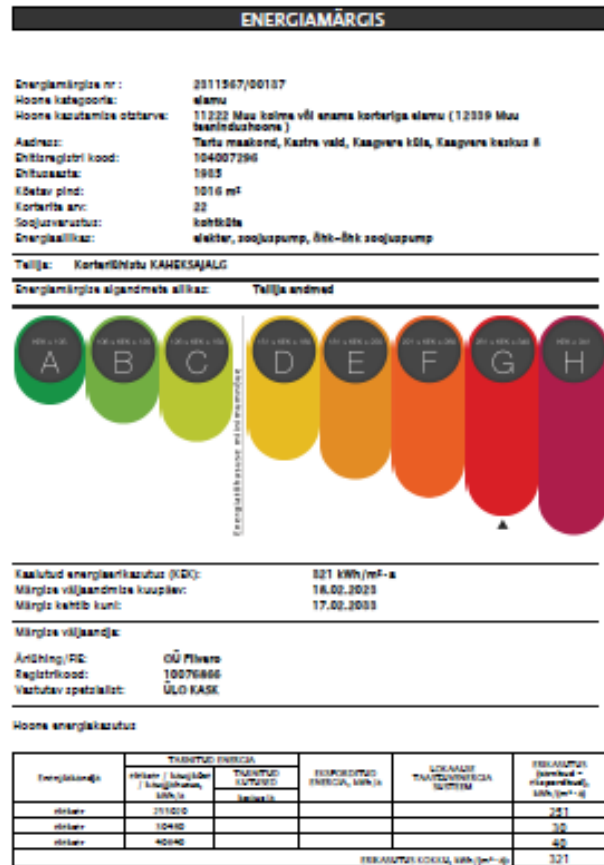
Joonis 1, KEK, energiatõhususe klass "G" 321 kWh/m 2 a

Selle hoone kandvad seinad on poorbetoonist. Eelmise sajandi teisel poolel Eestis kasutusel olnud poorbetooni tunti ka Palivere plokina. Tootmistehnoloogia seisneb lubja, liiva ja lisandite jahvatamises desintegratsiooniveskis ja sellele järgnevalt autoklaavimisest. Eestis toodeti neid plokkide erineva koostisega ja erinevates tootmisviisides Palivere ja Aravete tehastes, mistõttu ei ole võimalik hinnata konkreetse hoone jaoks kasutatavate plokkide täpseid füüsikalisi omadusi, teadmata nende valmistamise aega, kohta ja tingimusi. Sarnase tehnoloogiaga suuri plokkide toodeti ka Narvas ja Ahtmes, kasutades lisaks lubjale või selle asemel põlevkivituhka ja tsementi. Üldiselt hinnati Kääpa hoone seinapaksuseks 30 cm ja soojusläbivuseks U \approx 0,9 \text{ W/m}^2\text{K} .